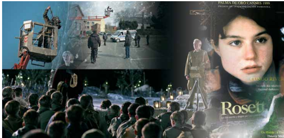
© ClapLiège Congo River © Les Films de la Passerelle Joyeux Noël © Nord-Ouest Production Rosetta © Les Films du Fleuve