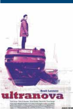
Ultranova