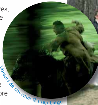
Voileurs de chevaux