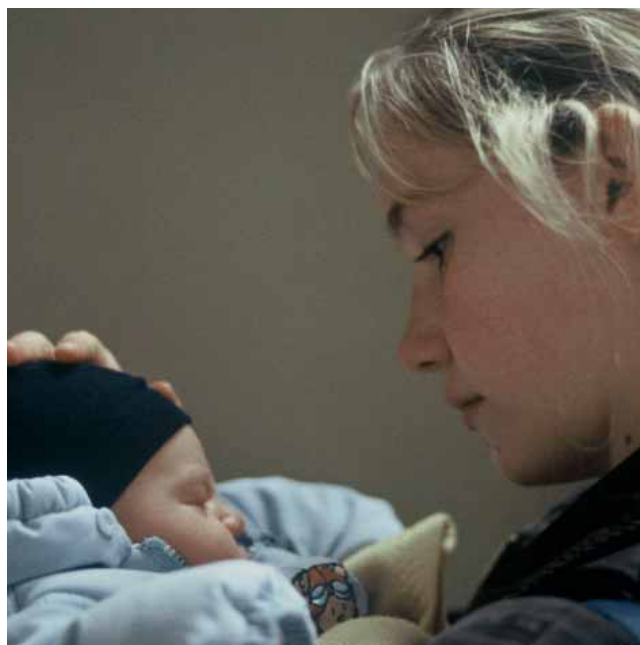
Déborah François

Ce ne sont que quelques exemples d'un important potentiel d'acteurs et de comédiens, issus des Conservatoires, Académies ou autres filières de formation.